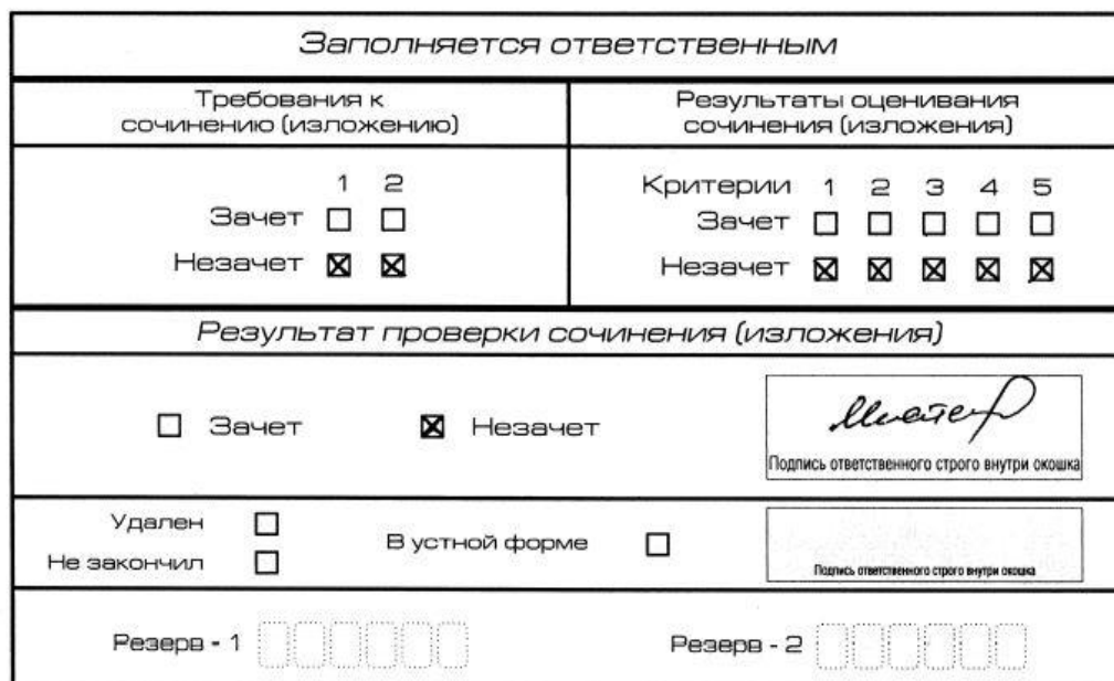
Рис. 7. Область для оценки работы

Выставляется «незачет» за невыполнение требования №2. В клетки по всем критериям оценивания выставляется «незачет». В поле «Результат проверки сочинения (изложения)» ставится «незачет» (рис. 8).