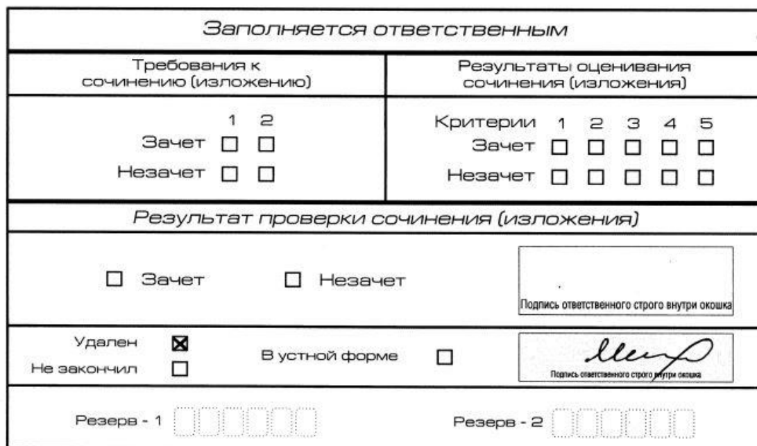
Рис. 12. Заполнение полей нижней части бланка регистрации (удаление с экзамена)

(участник итогового сочинения (изложения) должен поставить свою подпись в указанной форме). В бланке регистрации указанного участника итогового сочинения (изложения) необходимо внести отметку «X» в поле «Удален». Внесение отметки в поле «Удален» подтверждается подписью члена комиссии по проведению итогового сочинения (изложения) (рис. 12).