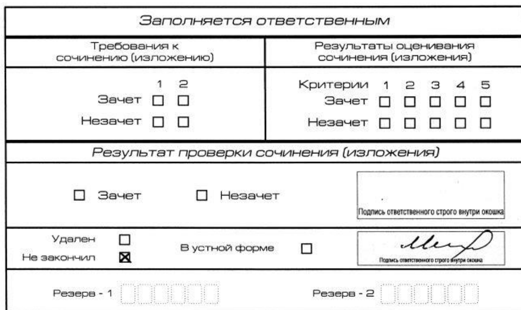
Рис. 11. Заполнение полей нижней части бланка регистрации (участник не закончил написание сочинения (изложения) по уважительным причинам)

итогового сочинения (изложения) по уважительным причинам» (форма ИС-08), вносят соответствующую отметку в форму ИС-05 «Ведомость проведения итогового сочинения (изложения) в учебном кабинете ОО (месте проведения)» (участник итогового сочинения (изложения) должен поставить свою подпись в указанной форме). В бланке регистрации указанного участника итогового сочинения (изложения) необходимо внести отметку «X» в поле «Не закончил» для учета при организации проверки, а также для последующего допуска указанных участников к повторной сдаче итогового сочинения (изложения) в дополнительные сроки. Внесение отметки в поле «Не закончил» подтверждается подписью члена комиссии по проведению итогового сочинения (изложения) (рис. 11).