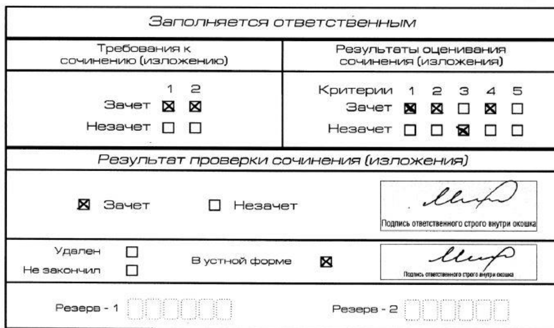
Рис. 10. Область для оценки работы сочинения (изложения) в устной форме

После окончания заполнения бланка регистрации ответственное лицо ставит свою подпись в специально отведенном для этого поле.