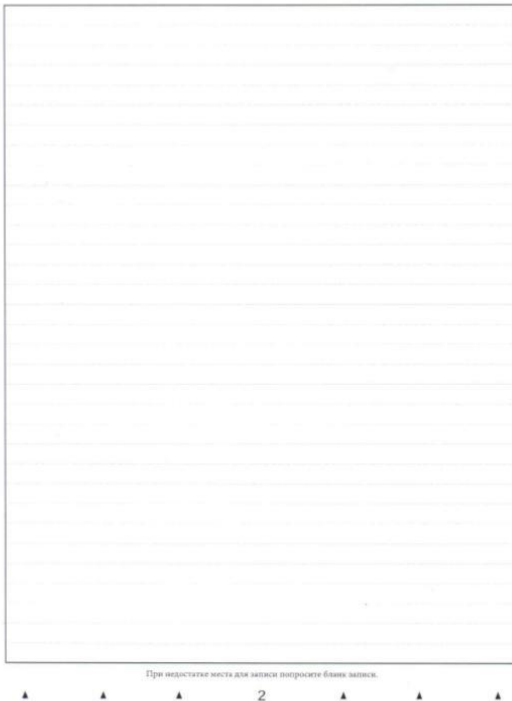
Рис. 6. Обратная сторона двустороннего бланка записи

4.4. В случае использования двустороннего бланка записи при недостатке места для оформления итогового сочинения (изложения) на лицевой стороне бланка записи участник может продолжить записи на оборотной стороне бланка (рис. 6), сделав внизу лицевой стороны запись «смотри на обороте».