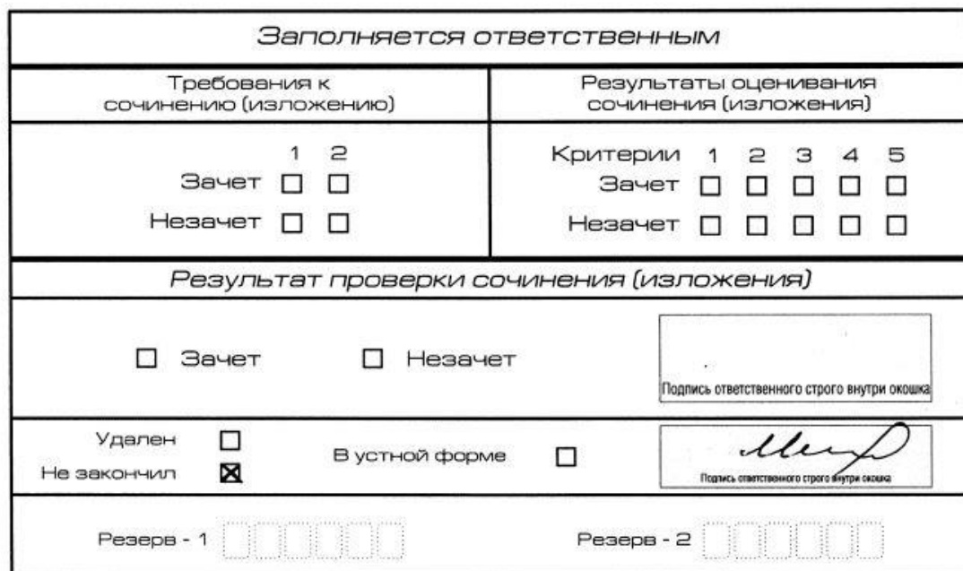
Рис. 11. Заполнение полей нижней части бланка регистрации (участник не закончил написание сочинения (изложения) по уважительным причинам)

вносят соответствующую отметку в форму ИС-05 «Ведомость проведения итогового сочинения (изложения) в учебном кабинете ОО (месте проведения)» (участник итогового сочинения (изложения) должен поставить свою подпись в указанной форме). В бланке регистрации указанного участника итогового сочинения (изложения) необходимо внести отметку «X» в поле «Не закончил» для учета при организации проверки, а также для последующего допуска указанных участников к повторной сдаче итогового сочинения (изложения) в дополнительные сроки. Внесение отметки в поле «Не закончил» подтверждается подписью члена комиссии по проведению итогового сочинения (изложения) (рис. 11).