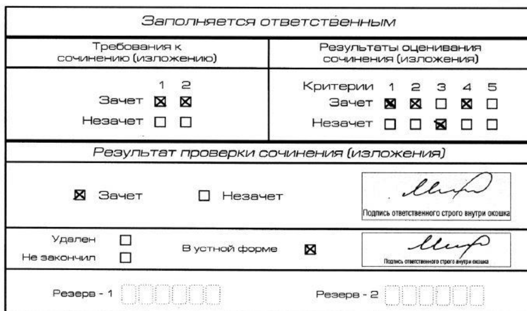
Рис. 10. Область для оценки работы сочинения (изложения) в устной форме

После окончания заполнения бланка регистрации ответственное лицо ставит свою подпись в специально отведенном для этого поле.